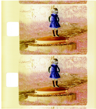
Super 8 Farbnegativ