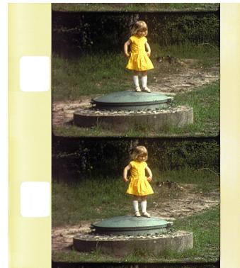
Super 8 Farbpositiv

Als weltweit einziges Kopierwerk eröffnet ANDEC Filmtechnik die Möglichkeit, von Super8 - Farbnegativen Positivkopien herzustellen.